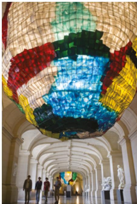
Gaetano Pesce Les lustres de Pesce 1997 Palais des Beaux-Arts de Lille

La Collection Hauts-de-France nous offre un exemple de création d'œuvre in situ commandé au designer italien Gaetano Pesce par le Palais des Beaux-Arts de Lille dans les années 1990. Les architectes Ibos et Vitart ont pour préoccupation d'apporter la lumière dans le hall. Leur appel à un designer italien est motivé par deux grandes ouvertures circulaires, appelées oculi. Depuis la création du musée, elles permettent de faire descendre la lumière du premier étage jusqu'au rez-de-chaussée. Pesce crée deux lustres colorés, une paire d'œuvres semblables, monumentales, de 6,3 mètres de diamètre. Ils sont constitués d'une série de plus de 12000 tuiles de verre coloré et thermoformé fabriquées aux Etats-Unis par l'entreprise Verres Bullseyes Glass Co.