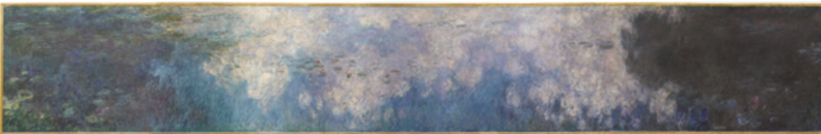
Claude Monet Les Nymphéas : Nuages Vers 1915-1926 Musée d'Orsay

John Coplans sera le premier artiste à consacrer une exposition, Serial Imagery , dédiée à la sérialité comme processus créatif, en 1968, au Pasadena Art Museum (aujourd'hui Norton Simon Museum), près de Los Angeles en Californie. C'est dans le contexte de cette exposition que Roy Lichtenstein s'inspira de Monet pour créer ses Manufactured Monets .