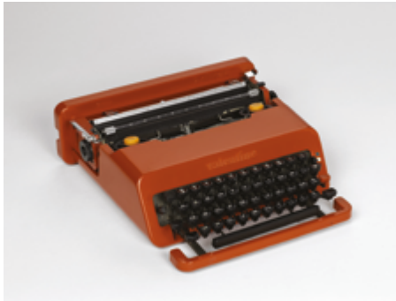
Ettore Sottsass Machine à écrire portative Valentine 1969 Centre Pompidou

Une date importante dans l'histoire du design est celle de la commercialisation de la machine à écrire par Remington en 1873. Presque un siècle plus tard, en 1969, en plein dans les Trente Glorieuses et la société de consommation, la machine à écrire en plastique au design « Valentine » d'Ettore Sottsass et Perry King marque les débuts de l'électronique. Portable et maniable, elle est inspirée du pop art en contraste avec l'univers traditionnel de la bureautique. Son nom, lui, est inspiré du jour de sa sortie, la Saint-Valentin. Une campagne de publicité exploite, pour son lancement, l'univers du pop art.