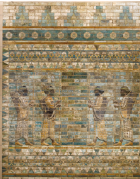
Frise des archers Vers 510 av. J.-C. Musée du Louvre

La réalisation de décors (frises murales, pavements) utilise souvent des éléments semblables fabriqués en série, à l'exemple de l'assemblage monumental de briques siliceuses de la Frise des archers qui représente un défilé d'archers quasi identiques dans un encadrement de frises décoratives. Chaque élément, produit en série, constitue une pièce d'une frise reproduisant des figures humaines et géométriques.