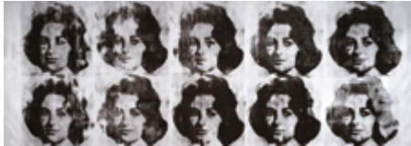
Andy Warhol Ten Lizes 1963 Centre Pompidou