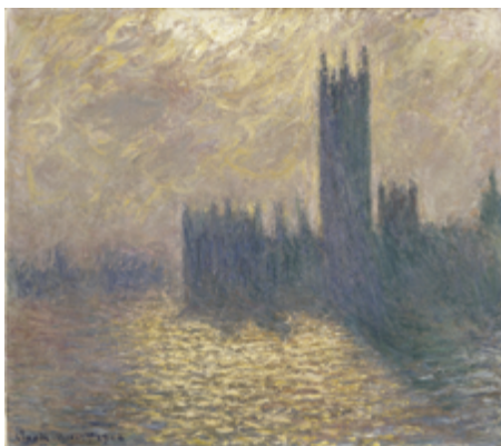
Palais des Beaux-Arts de Lille Le Parlement de Londres 1904 Claude Monet

Monet s'engage dans une recherche d'un instantané atmosphérique, par le moyen des séries : une série de 19 tableaux, de taille similaire et de cadrage identique représentant le Parlement de Londres. Ce qui est intéressant est qu'il s'agit d'une démarche de recherche de création. Ces vues sont peintes d'abord depuis le Saint Thomas' Hospital en fin d'après-midi et au coucher du soleil. Monet les poursuit jusqu'en 1904, de retour en France, notamment d'après des photographies prises sur place. Réalisées sur places, ces toiles sont donc retravaillées ensuite d'après des photographies.