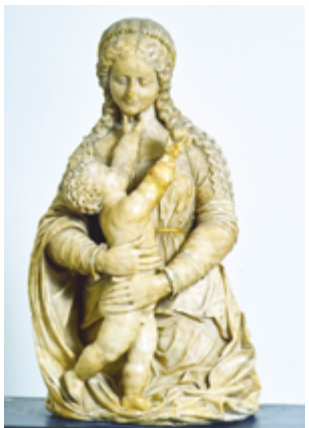
Conrad Meit ou atelier Vierge à l'enfant Vers 1530 Musée d'archéologie et d'histoire locale de Denain Communauté d'agglomération de La Porte du Hainaut

La représentation de la maternité est récurrente dans toutes les civilisations. Le thème de la femme à l'enfant a été répété dans toutes les formes d'art, bien avant l'ère chrétienne. Les Vierges à l'enfant sont caractéristiques de la répétition d'un thème traditionnel immédiatement reconnaissable et codifié.