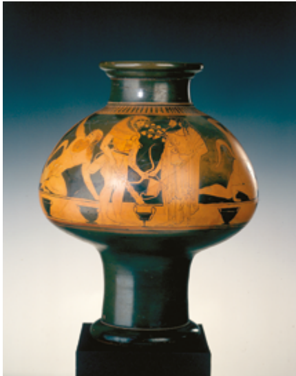
Peintre de Kléophradès Psykter de style attique à figure rouge Vers 500 avant J.-C. Musées de la ville de Compiègne - Musée Antoine Vivanel

Les objets du quotidien, même à vocation décorative ou votive, sont rarement des objets uniques et sont le produit d'une fabrication artisanale en série, parfois reconnaissable par un "style" qui permet de les identifier et de les classer, sur la céramique par exemple.