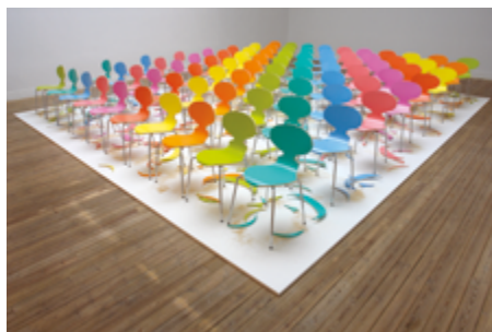
SUPERFLEX Copy Right (colored version) 2007 Frac Grand Large - Hauts-de-France

La création d'objets utilitaires est au centre des recherches du designer danois Arne Jacobsen. L'installation Copy Right nous apporte un regard critique et contemporain sur la production en série de chaises qu'il a créées. Quarante chaises sont disposées en alignement dans l'espace. Elles ne sont pas des originaux, mais des reproductions. Elles ont été découpées et transformées. Ainsi, les chaises identiques produites en série, de plus des copies d'un modèle original, deviennent autant de modèles uniques, inversant la notion de production en série.