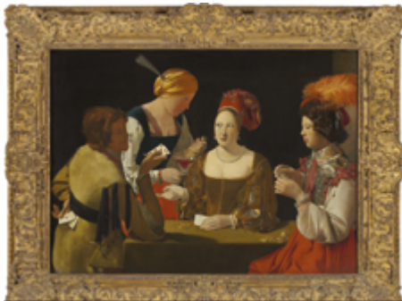
Georges de La Tour Le Tricheur à l'As de Carreau Vers 1635-1638 Musée du Louvre

Au XVII e siècle, Georges de La Tour peint deux tableaux d'une scène de tricheur : Le Tricheur à l'As de Trèfle , 1634, Huile sur toile, 98 x 156 cm, Forth Worth, Kimbell Art Museum et Le Tricheur à l'As de Carreau vers 1635-1638, Louvre. Ce sujet a été traité par Le Caravage vers 1594 (94,3 x 131,1 cm, Fort Worth, Kimbell Art Museum) dont La Tour reprit le motif du personnage de trois quarts dos, après d'autres peintres, caravagistes, Français et Flamands.