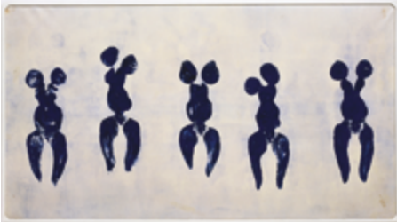
Yves Klein ANT 82 ou Anthropométrie de l'époque bleue 1960 Centre Pompidou