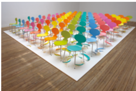
SUPERFLEX Copy Right (colored version) 2007 Frac Grand Large - Hauts-de-France