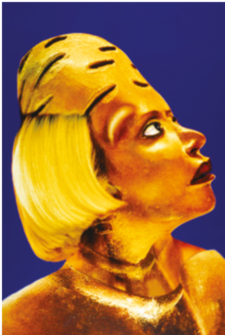
ORLAN Refiguration/Self-Hybridation n°2 1998 Centre Pompidou

L'artiste française ORLAN a transformé ses portraits photographiques au moyen d'un logiciel informatique de morphing. Elle crée des séries de portraits où elle métamorphose son image en hybride d'elle-même combinée avec des sculptures africaines, amérindiennes, aztèques et mayas : ses séries sont appelées Défiguration-Refiguration , Self-hybridations précolombiennes , 1998, Self-hybridations Africaines , 2000-2003, Self-hybridations Amérindiennes , 2005-2008. Il s'agit d'un moyen pour dénoncer les pressions exercées sur le physique de la femme.