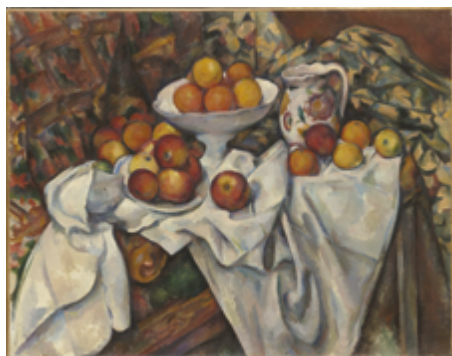
Paul Cézanne Pommes et oranges Vers 1899 Musée d'Orsay

Notions : Les cinq sens / Formes / Poésie des objets / Couleurs