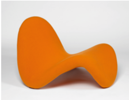
Pierre Paulin Siège 577 dit Tongue « Langue » 1967 Centre Pompidou

La Collection nationale #1 nous donne un autre exemple de conception révolutionnaire du siège : le siège Tongue empilable de Pierre Paulin. Influencé par le design et la modernité des pays du nord et des designers américains, en particulier dans les aspects industriels, il crée du mobilier fonctionnel et accessible au plus grand nombre. Sa collaboration avec Artifort apporte une révolution : housses textiles extensibles, monobloc, sans couture, qui se retirent, sont lavables, et surtout peuvent être changées selon l'envie de couleur.