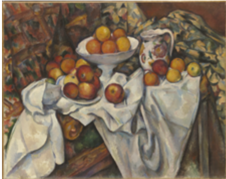
Paul Cézanne Pommes et oranges Vers 1899 Musée d'Orsay