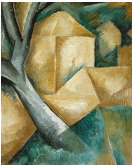
Georges Braque Maisons et arbre Été 1908

LaM – Lille Métropole Musée d'art moderne, d'art contemporain et d'art brut