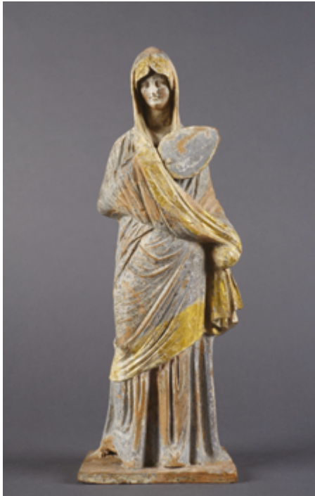
Les statuettes de Tanagra : Femme drapée dans son himation tenant un éventail Vers 300 av. J.-C. Musée du Louvre

Les statuettes de la ville de Tanagra (en Béotie, à l'est de Thèbes) sont célèbres pour leurs ateliers qui ont produit en série des figurines humaines en terre cuite moulée à partir de 340-330 av. J.-C. jusque vers la fin du IIIe siècle.