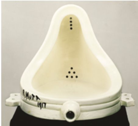
Marcel Duchamp Fontaine (Urinoir) 1917 / 1964 Centre Pompidou