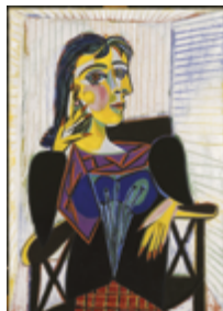
Pablo Picasso Portrait de Dora Maar 1937 Musée National Picasso - Paris