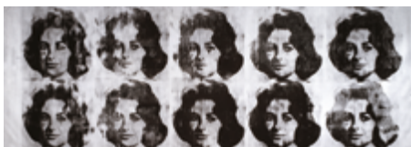
Andy Warhol Ten Lizes 1963 Centre Pompidou

Andy Warhol utilise la sérigraphie pour reproduire des photographies d'objets populaires du quotidien, ou d'acteurs et chanteurs célèbrés dans la presse comme Marilyn ou Liz Taylor. Le report sérigraphique sur toile est la technique que Warhol utilise désormais dans toutes ses séries. Elle consiste à reproduire le motif (la matrice), qui peut l'être indéfiniment jusqu'à épuisement. Des assistants interviennent pour terminer les séries. Ce qui est intéressant comme réflexion avec les élèves, c'est le statut des copies, qui deviennent des œuvres originales et uniques malgré leurs ressemblances, car des différences apparaissent entre elles. C'est le cas pour Ten Lizes , une série de dix portraits de l'actrice Elizabeth Taylor (dont le surnom est Liz). Warhol utilise une photographie promotionnelle reproduite sur une toile dix fois, avec des différences. La disposition évoque l'image filmée.