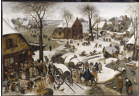
Pieter Bruegel le Jeune Le Dénombrement de Bethléem Vers 1610-1620 Palais des Beaux-Arts de Lille

Notions : Paysage / Formes / Poésie des objets / Couleurs