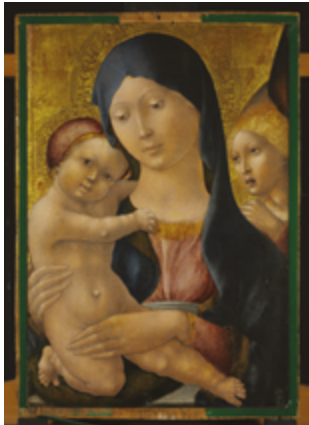
Libérale da Verona Vierge à l'enfant avec un ange Vers 1468-1470