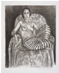
Henri Matisse Grande Odalisque à la culotte bayadère 1925 Musée départemental Matisse - Le Cateau-Cambrésis

Des artistes se sont inspirés d'un même sujet pour créer une série de représentations de la femme, supports de leurs recherches plastiques et esthétiques. A partir du XIXe siècle, l'Orientalisme leur fournira le sujet de l'odalisque (femme du harem du sultan). Ces représentations de nus dans un décor oriental sont pour Matisse une exploration de la figure dans l'espace.