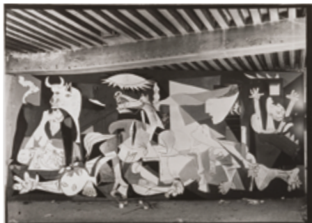
Dora Maar Guernica en cours d'exécution aux Grands Augustins 1937 Musée national Picasso - Paris

Dora Maar a, elle, constitué une restitution des étapes successives de la création de Guernica par Picasso, apportant un éclairage exceptionnel sur la genèse de l'œuvre. Une série de photographies montre Picasso au travail. Une autre, les différentes étapes de la réalisation du tableau. Ces photographies ont, à leur tour, fortement influencé le processus de création de Picasso, notamment sur le choix du noir et blanc, le peintre modifiant son projet en fur et à mesure des photographies.