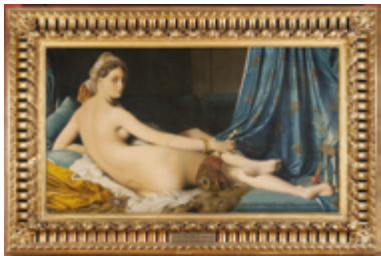
Jean-Auguste-Dominique Ingres La Grande Odalisque 1814 Musée du Louvre