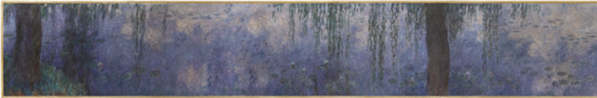
Claude Monet Les Nymphéas : Le Matin aux saules Vers 1915-1926 Musée d'Orsay

Les recherches de Monet sur la perception humaine des variations de temps, lumière et couleurs, de la série de la Cathédrale de Rouen sont investies soixante ans plus tard par Roy Lichtenstein à travers sa réalisation sérielle Manufactured Monets de panneaux sérigraphiés.