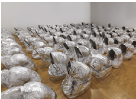
Kader Attia Ghost 2007 Centre Pompidou