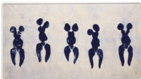
Yves Klein ANT 82 ou Anthropométrie de l'époque bleue 1960 Centre Pompidou

Totalement différente est la démarche d'Yves Klein, qui en 1960, utilise le corps féminin, tel un « pinceau vivant », pour déposer une trace de peinture bleu sur des papiers disposés sur le sol ou agrafés au mur. Une performance publique en musique à la Galerie internationale d'art contemporain à Paris aura pour résultat une série d' Anthropométries de l'époque bleue . Klein fit breveter ce procédé auprès de l'INPI (Institut national de la propriété industrielle).