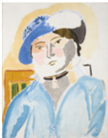
Henri Matisse Marguerite au chapeau de cuir 1944 Musée départemental Matisse - Le Cateau- Cambrésis