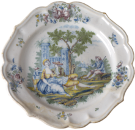
Manufacture Sta Plat à bord chantourné, décor de scène pastorale à la Boucher Vers 1780 Musée de la Céramique

Comme une mise en abîme, l'imitation d'un style, d'un motif ou d'une figure est habituelle pour une production en série de la céramique par exemple. Ainsi, les scènes pastorales, telles que celles de Boucher au XVIII e siècle, sont reproduites comme motifs de décor. Le décor pouvait être réalisé au moyen d'un poncif qui consiste à percer de petits trous les contours d'un dessin tracé sur papier calque. Ce procédé permettait de reprendre le motif, proche de la série, sur d'autres pièces de faïences. Le peintre en faïence Vander Plas nous en donne une illustration.