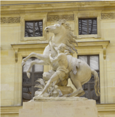
Musée du Louvre Cheval retenu par un palefrenier dit Cheval de Marly 1739 – 1745 Guillaume Coustou

La paire est déjà un exemple de série dont la visée est la mise en perspective d'une représentation. Les Chevaux de Marly constituent une paire en marbre de deux grands chevaux retenus par des palefreniers dans un mouvement spectaculaire. Ils ont été commandés dès 1739 pour être mis en scène dans le bassin de l'Abreuvoir du parc du Château royal de Marly, en remplacement d'une autre paire. Cette commande devait ainsi prendre en compte des contraintes de placement, de fonction et de contexte. Ils évoquent la tradition des groupes antiques. Des copies en moulages ont été réalisées pour la Place de la Concorde, puis en 1985 par le sculpteur Michel Bourbon afin de les placer à leur emplacement d'origine, près de l'abreuvoir de l'ancien Château de Marly à Marly-le-Roi dans les Yvelines.