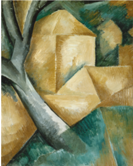
Georges Braque Maisons et arbre Été 1908 LaM – Lille Métropole Musée d'art moderne, d'art contemporain et d'art brut