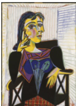
Pablo Picasso Portrait de Dora Maar 1937 Musée National Picasso - Paris

Pour Matisse , il s'agit de reprendre une étape de travail, de faire évoluer dans le temps sa représentation : « A chaque étape, j'ai un équilibre, une conclusion. A la séance suivante, si je trouve qu'il y a une faiblesse dans mon ensemble, je me réintroduis dans mon tableau par cette faiblesse [...] et je reconçois le tout. Un noir peut très bien remplacer un bleu puisqu'au fond l'expression vient des rapports. On n'est pas esclave d'un bleu, d'un vert ou d'un rouge. Vous pouvez changer les rapports en modifiant la quantité des éléments sans changer leur nature », propos rapporté par Tériade en 1936. Il explore de manière répétitive son sujet, reprenant son premier jet spontané, d'abord à travers des paires, puis à travers des variations prenant appui sur la trace photographique par exemple.